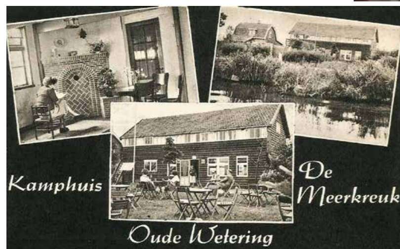
Een ansichtkaart van het Kamphuis, 1947.