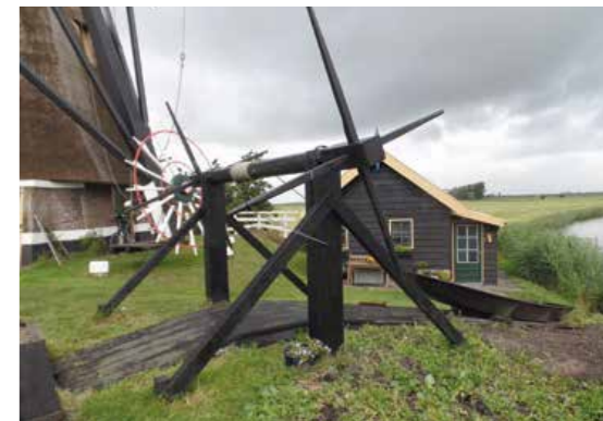
De overhaal naast de molen. De polder had ook nog een sluis die toegang gaf tot de polder, maar die werd in 1883 opgeruimd. Op de achtergrond de praktijkruimte van Alice de Wit.