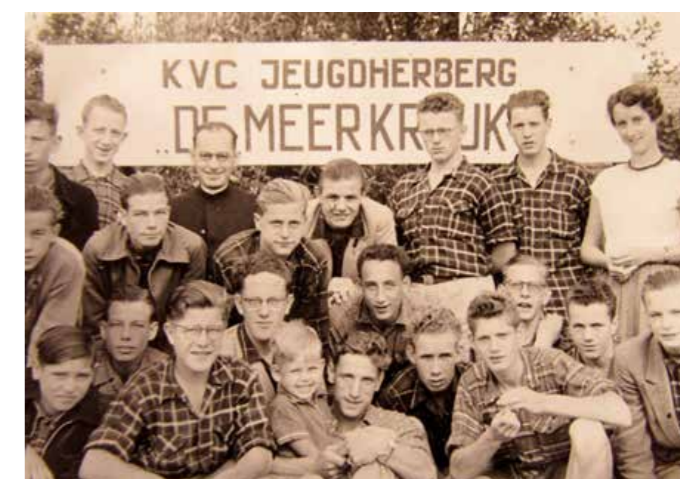
1953, een groep Duitse jongeren voor de KVC-jeugdherberg.