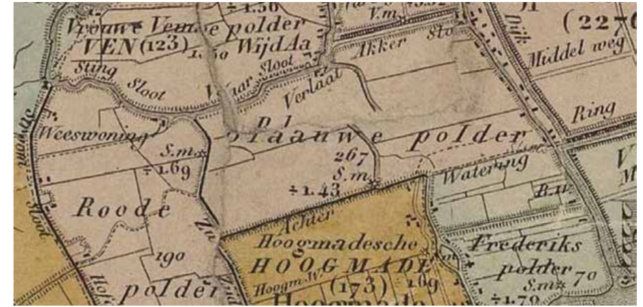
De Blauwe polder met de omringende polders; fragment van de kaart van het Hoogheemraadschap van Rijnland van J. Kros uit 1855. (Archief Hoogheemraadschap van Rijnland)

De Oud Aase polder werd gesticht op 7 april 1629. De polder werd later bekend als de Blauwe polder, vernoemd naar de kleur van het blauw geschilderde bovenhuis van de wipmolen van destijds. De polder werd geheel ingesloten door boezemwater: aan de noordzijde door de Akkersloot, de Oude Ade en de Vaarsloot of Stingsloot; aan de westzijde door de Zuidzijdervaart;