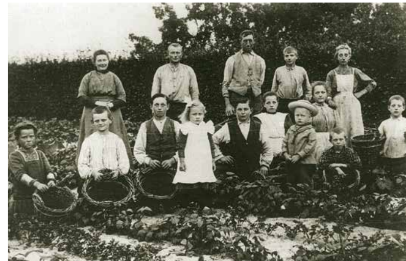
De hele familie is bij elkaar geroepen voor de oogst van de groenten. Zijn het aardappelen, sperziebonen, of iets anders? Verdere gegevens onbekend.

Hij studeerde sociale en economische geschiedenis in Leiden. Vervolgens werkte hij onder meer in het buurtwerk, de volwasseneneducatie, de automatisering en als bestuurs- en beleidsadviseur bij de gemeente Leiden. Tegelijkertijd publiceerde hij regelmatig over lokale geschiedenis. Sinds 2002 werkt hij als freelance historicus. Hij bereidt een proefschrift voor over kinderarbeid.