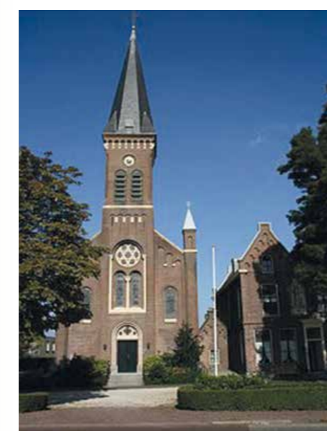
De H. Bavokerk in Oud Ade.