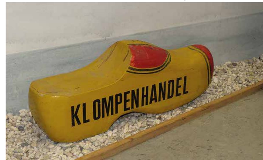
De klomp van Rasse in het museum.

omgesprongen,” aldus Wils, die zelf in de automatisering werkzaam is geweest.