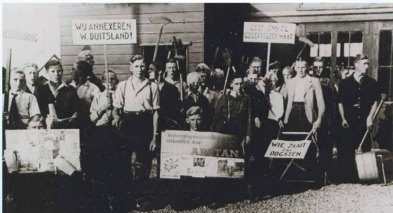
Bij de kermisoptocht in 1948 gaven jonge tuinders, met een corsokar, aan dat zij ook tuinbouw wilde in de Googerpolder.