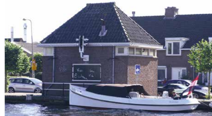
Het machinegebouw van de schulpstuw in de Oude Wetering.

Het boek 'Lief en leed aan de Hanepoel', over de geschiedenis van de familie Van Schie, is ook in het museum te koop. De prijs is € 29,50.