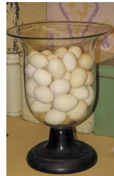
De glazen bokaal voor de eieren.