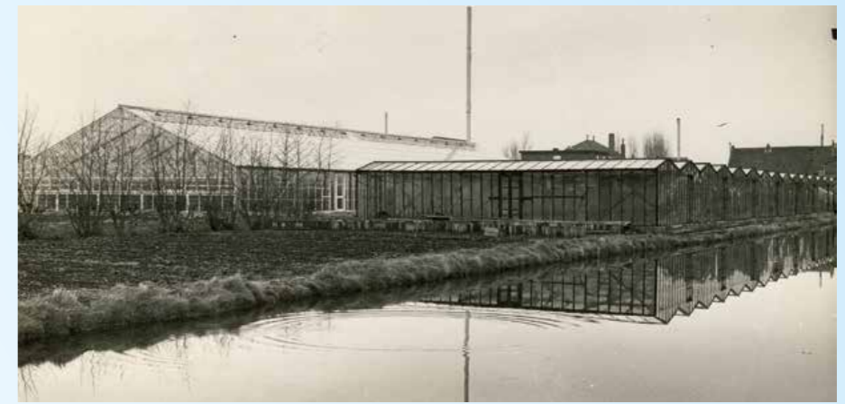
Een oude en nieuwe kas naast elkaar.

Gezien de grote veranderingen in de huishouding en in het gezin had de huis-