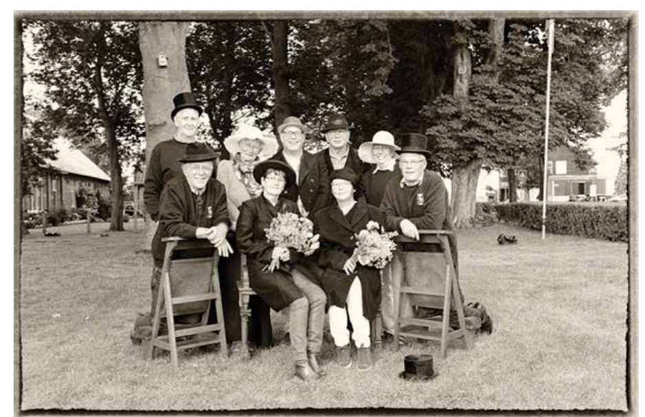
De afvaardiging van der Stichting Oud Alkemade geportretteerd voor de H. Bavokerk.