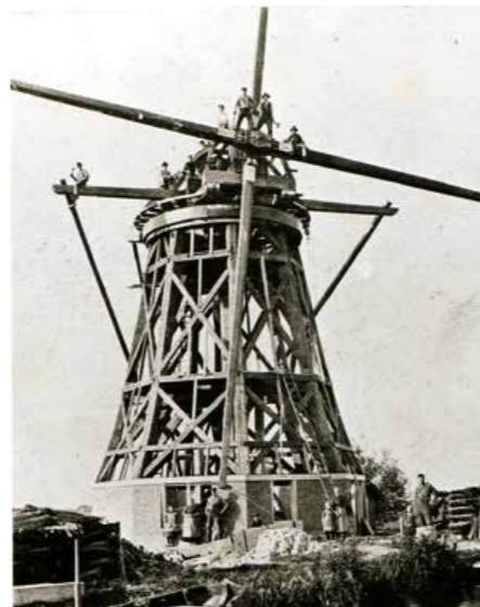
De opbouw van de nieuwe achtkante molen en de gevelsteen uit 1904.

De Blauwe molen in het polderlandschap; rechts naast de overhaal de kerktoren van Rijpwetering.